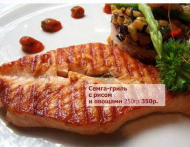
Семга-гриль с рисом и овощами 250гр 350р.