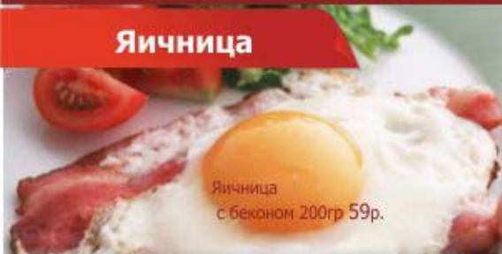
Яичница с беконом 200гр 59р.