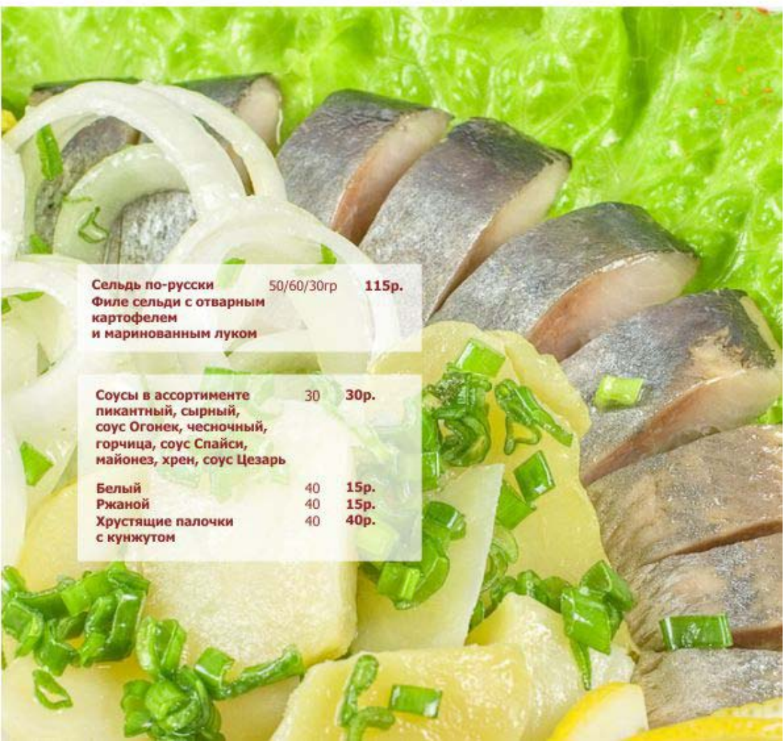
Сельдь по-русски 50/60/30р 115р. Филе сельди с отварным картофелем и маринованным луком