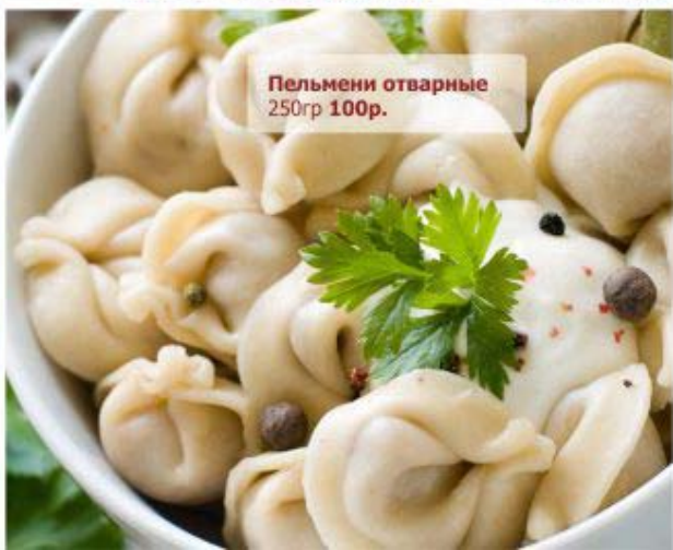
Пельмени отварные 250гр 100р.