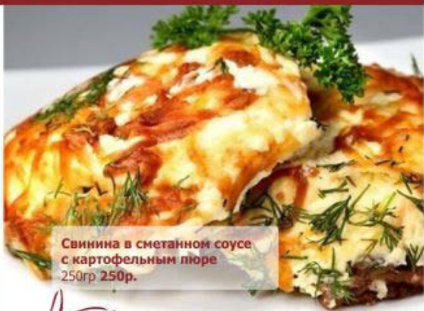
Свинина в сметанном соусе с картофельным пюре 250гр 250р.