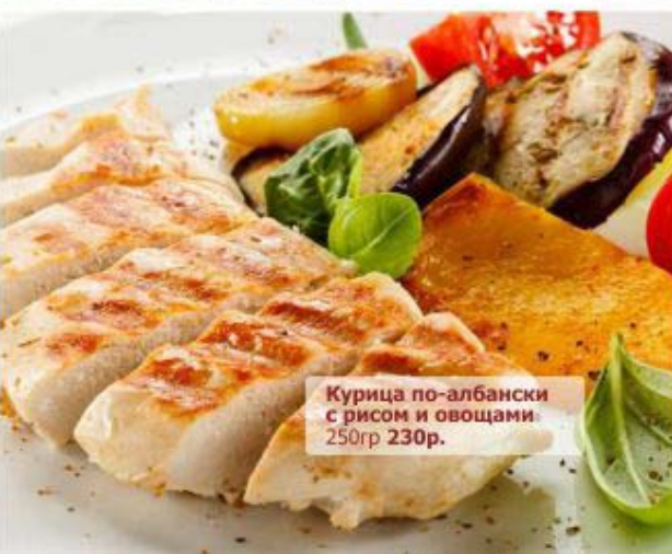
Курица по-албански с рисом и овощами 250гр 230р.