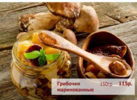
Грибочки маринованные 150р 115р.