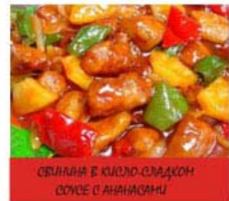
СВИНИНА В КИСЛО-СЛАДКОМ СОУСЕ С АНАНАСАМИ