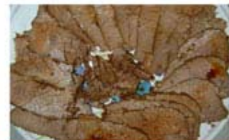
НАРЕЗКА ИЗ ГОВЯДИНЫ В СОЕВОМ СОУСЕ