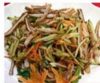
САЛАТ "УШИ С ОВОЩАМИ"