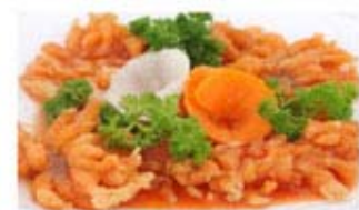
ФИЛЕ СВИНИНЫ В КИСЛО-СЛАДКОМ СОУСЕ