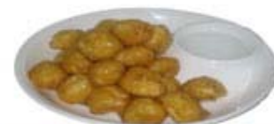
ЯБЛОКО В КАРАМЕЛИ