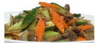
САЛАТ "ЯЗЫК С ОВОЩАМИ"