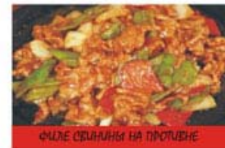
ФИЛЕ СВИНИНИ НА ПРОТУВНЕ