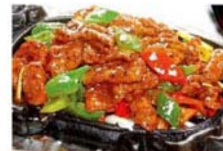
ГОВЈАДИНА НА ПРОТУВНЕ