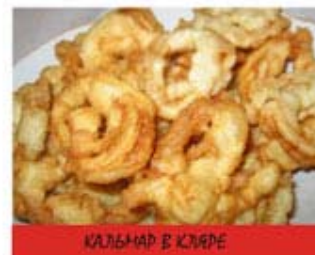
КАЛЬМАР В КЛЯРЕ