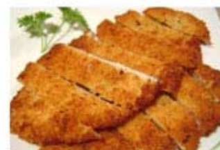
КРЫЛЬЯ КУРИНЫЕ ЖАРЕННЫЕ В КОКА-КОЛЕ