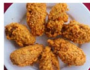
ЖАРЕННЫЕ КРЫЛЬЯ ИНДЕЙСКИ