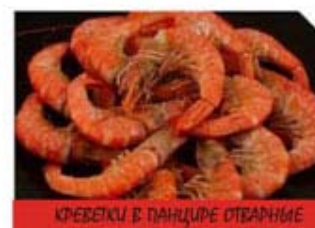
КРЕБЕТКИ В ПАНЦИРЕ ОТВАРНЫЕ