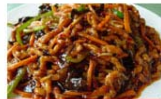
СОЛОМКА ИЗ СВИНИНЫ С ГРИБАМИ В КИСЛО-СЛАДКОМ СОУСЕ