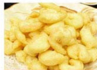
КРЕБЕТКИ В КЛЯРЕ