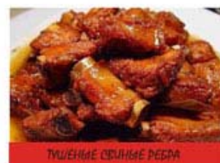
ТУШЕННЫЕ СВИНЫЕ РЕБРА