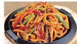
КАЛЪМАР НА ПРОТУВНЕ